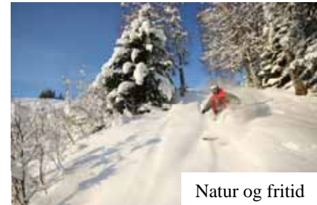
Natur og fritid