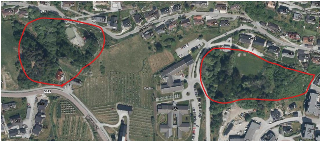
Bilete 1: Dei raude sirklande syner dei to viktige grøne lungene som må ivaretakast.

Det blir også viktig å ta omsyn til plassering av bustadar nær desse nærmiljøanlegga, då det erfaringsmessig kan bli konflikantar mellom brukarar av slike anlegg og bebuarar i nærleiken årsaka støyande aktivitetar frå til dømes ballspel, musikk, skateanlegg etc. Det er difor viktig at det i planbeidat leggast til grunn at følgjande rettleiar blir nytta: Støyvurdering ved etablering av nærmiljøanlegg – Veileder.pdf (helsedirektoratet.no) .