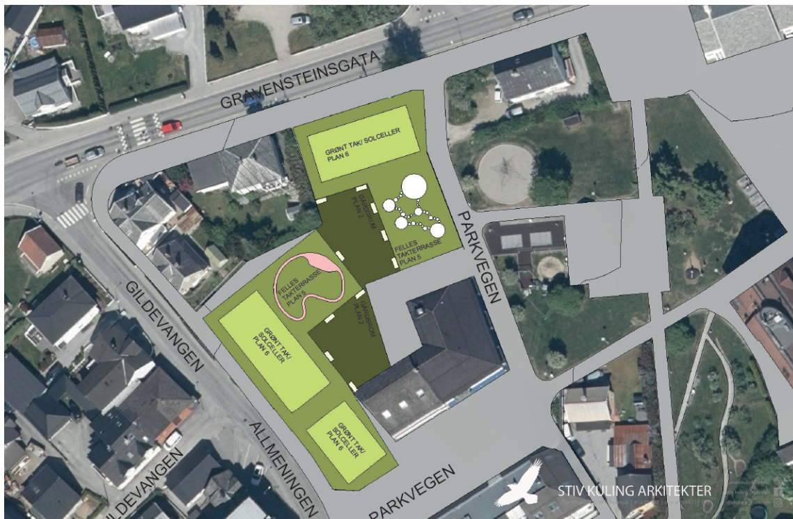
Figur 1: Enkel situasjonsplan utvikla som del av skisseprosjektet til arkitekt Stiv Kuling AS. Situasjonsplanen må lesast som ei skisse på tidleg stadium. Storleik, plassering og funksjonar, er ikkje endeleg avklara/bearbeidd.

parkeringsanlegg, grøntområde, tilpassing til veganlegg, mjuke samband og anlegg for transport av vatn, avlaup og overvatn.