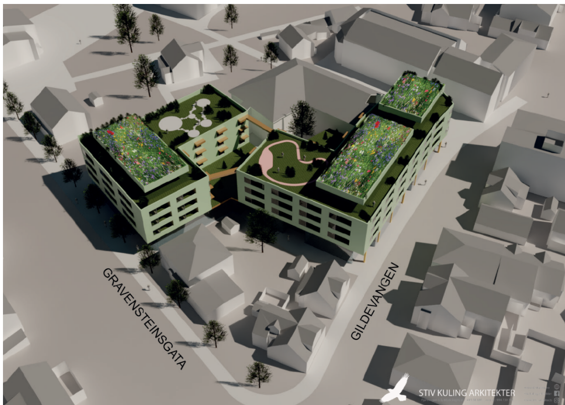
Figur 2: Skisseprosjekt utvikla av arkitekt Stiv Kuling AS. Det er ikkje gjeve at det er dette konseptet som skal vidareførast i framlegg til ny reguleringsplan.