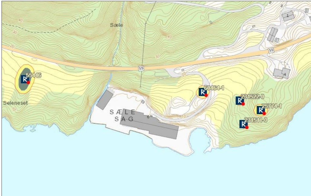
Figur 1. Kart som syner dei automatisk freda kulturminna i nærområde. Kart er henta frå Riksantikvaren sin database Askeladden.