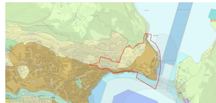
Større utsnitt av «tettstedgrense»