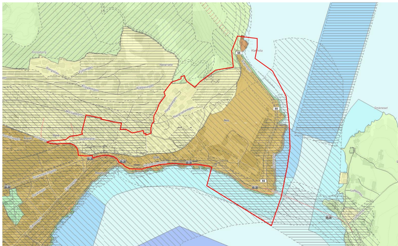
Gjeldande kommuneplan. Plangrense

«For område sett av til sentrumsføremål vert det stilt krav om utarbeiding av områdeplan jf. § 12-2, før detaljregulering, jf. § 12-3, kan finne stad.».