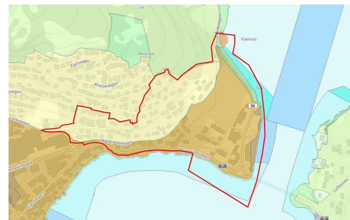
Kommuneplan 2023-2033 (under arbeid)